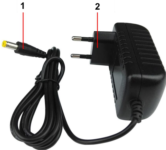
Рис. 1 Блок питания PS-5010, внешний вид, разъемы